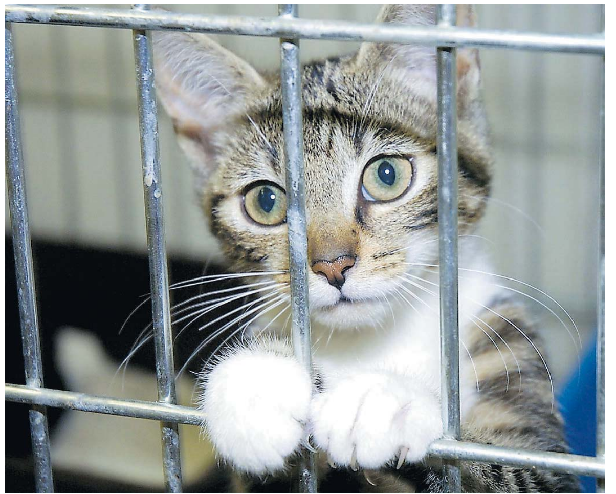
Neugierig blickt dieses Kätzchen aus seinem Zimmer im neuen Katzenhaus des Saarbrücker Bertha-Bruch-Tierheims. Wer will, kann es am Wochenende kennen lernen.